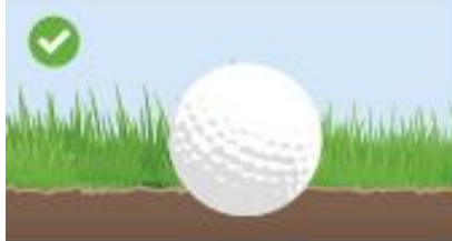
図16.3a: 球が地面にくい込んでいる場合